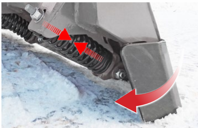
Schürfleiste mit Absorber-Federn